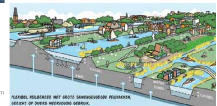
Het nieuwe watersysteem

Daarnaast krijgt Westflank 1 miljoen m 3 piekberging, een opvangbekken om tijdelijk water op te vangen bij extreme neerslag. Via een inlaat wordt het overtollige water uit de Ringvaart naar deze piekberging gelaten. De berging is een open stuk land, bijvoorbeeld een moeras- of natuurgebied. Met dijken eromheen die een mooi uitzicht geven. Eens in de tien of vijftien jaar loopt die piekberging onder met water.