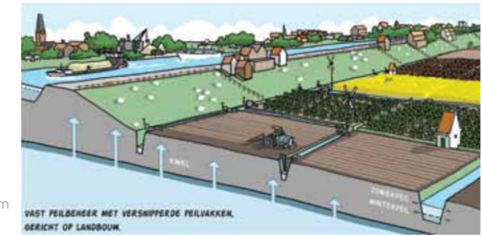
Het huidige watersysteem

Het huidige watersysteem in Haarlemmermeer is ingericht op de landbouw: een laag waterpeil in de winter met veel afvoer van overtollige neerslag en inlaat van water in de zomer om de tekorten aan te vullen. Het is een niet-duurzaam systeem dat bovendien niet ingericht is op klimaatveranderingen met meer regen, maar ook met meer droge periodes.